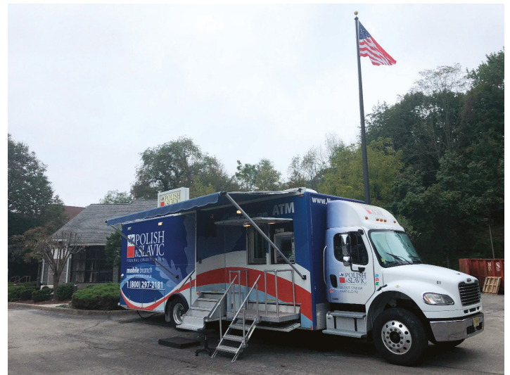
Oddział mobilny Naszej Unii przed budynkiem oddziału w Stroudsburgu, PA PSFCU Mobile Branch in front of the new branch in Stroudsburg, PA