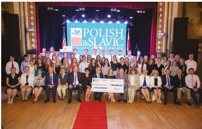
Ceremonia wręczenia stypendiów PSFCU na nowojorskim Brooklynie PSFCU Scholarship ceremony in Brooklyn, NY