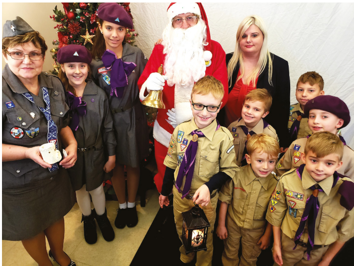
Każda okazja była dobra, aby zbierać datki na chore dzieci – wizyta Świętego Mikołaja w oddziale na Staten Island, NY / Funds for ill children were raised at every opportunity - pictured here, Santa Claus visits the PSFCU branch in Staten Island, NY

To była już piąta edycja wspólnej akcji Polsko-Słowiańskiej Federalnej Unii Kredytowej i nowojorskiej Fundacji Uśmiechu Dziecka. Od 2014 r. kwota zebranych środków przekroczyła już 610 tysięcy dolarów.