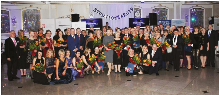
Bal Maturalny dla uczniów polskich szkół do kształcających na Wschodnim Wybrzeżu. Senior Prom for students of Polish Supplementary Schools on the East Coast

Na studniówce bawili się także absolwenci 37 sobotnich szkół polonijnych z Chicago i okolic. W sobotę, 26 stycznia w sali balowej teatru Drury Lane w Oak Brook obecnych było 550 maturzystów. Nasza Unia była jednym ze sponsorów studniówki, a wśród gości nie zabrakło kierowniczek pięciu oddziałów PSFCU z Chicagoland.