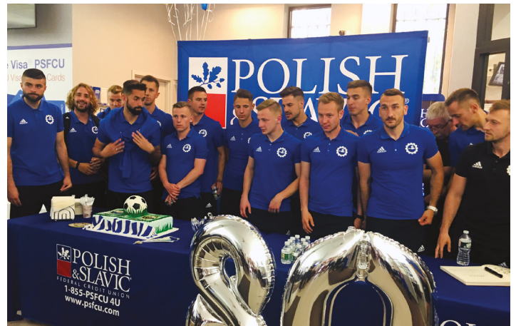
Piłkarze klubu piłkarskiego Stal Mielec odwiedzili oddział PSFCU w Ridgewood, NY Stal Mielec soccer club players visited the PSFCU branch in Ridgewood, NY

The legend of Polish rock music, the “Dżem” rock band was celebrating its fortieth anniversary in 2019. The jubilee concert tour included one concert in New York and two in Chicago. It was a great opportunity for the musicians to meet their fans at venues outside the concert hall. There was no better place than PSFCU branches in Ridgewood, NY and Mt. Prospect in the suburbs of Chicago. In addition to the joy of meeting their favorite band, forty fans were treated to a surprise: they won chances for free “Dżem” concert tickets, funded by the PSFCU for its members.