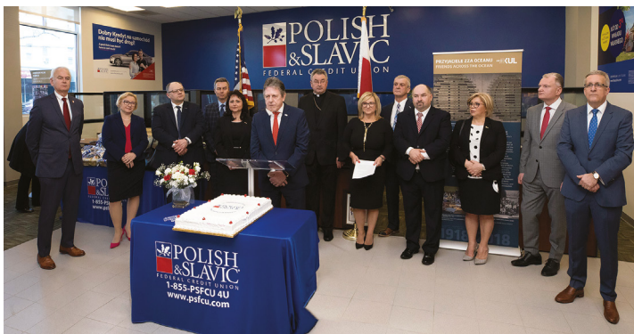
Uroczyste obchody 10-lecia oddziału PSFCU w Maspeth, NY Celebrating 10th Anniversary of the Maspeth, NY branch