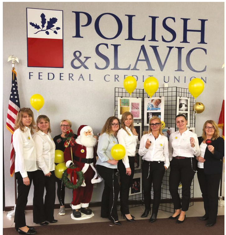
Pracownicy oddziału PSFCU w Ridgewood, NY zachęcają do dokonywania wpłat Employees of the PSFCU branch in Ridgewood, NY invite members to make donations

Three Polish hospices for children were the beneficiaries of this fundraising drive: Hospice operated by Caritas of the Archdiocese of Warmia in Olsztyn ($36,547), which was recommended by Poland's First Lady, Agata Kornhauser-Duda; Wrocław Hospice for Children Foundation ($35,076); and Rev. Eugeniusz Dutkiewicz SAC Hospice in Gdansk ($22,616). An additional $16,336 was donated to the Children's Smile Foundation to aid sick Polish-American children being treated in the United States.