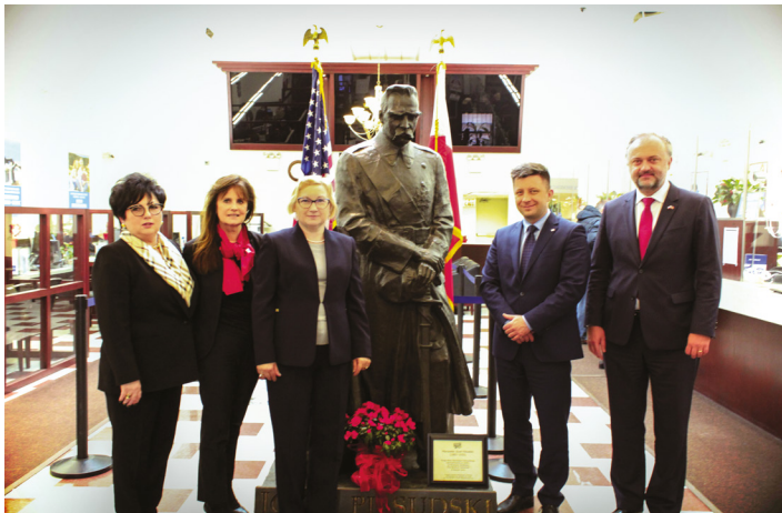
W czasie wizyty w Nowym Jorku, Michał Dworczyk, minister w Kancelarii Premiera RP odwiedził oddział PSFCU na Greenpoint Ave. / During his visit to New York, Michał Dworczyk, Minister in the Office of the Prime Minister of Poland visited the Greenpoint Ave. branch

W czwartek 21 marca w oddziale PSFCU w Norridge, IL gościł zespół Lady Pank na otwartej konferencji prasowej. To była jedyna możliwość - poza koncertem - spotkania z zespołem w Chicago i okolicach w czasie trasy koncertowej po Stanach Zjednoczonych. Spotkanie było okazją do zadania pytań nie tylko przez profesjonalnych dziennikarzy, ale także zwykłych fanów, którzy szczerze wypełnili pomieszczenia oddziału. Najbardziej wytrwali wielbiciele zespołu Lady Pank przyjechali z Tennessee, pokonując dziesięciogodzinną trasę. Przybyli także fani z Kanady.