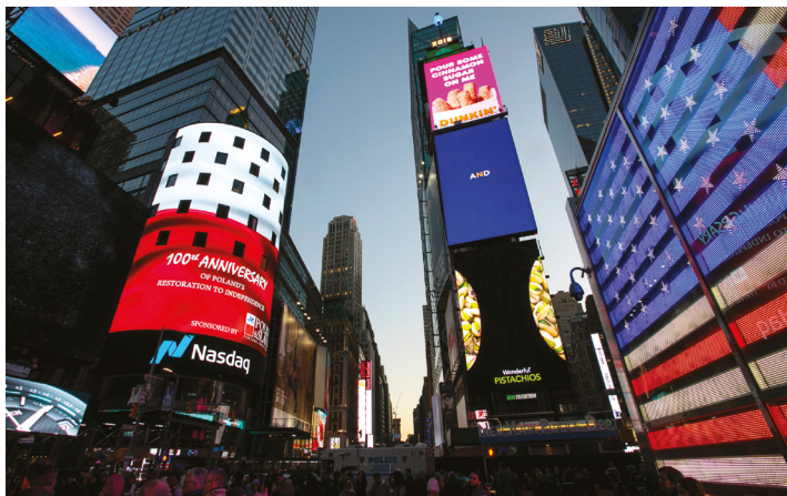
Sponsorowana przez PSFCU animacja upamiętniająca 100. rocznicę odzyskania niepodległości przez Polskę wyświetlana na nowojorskim Times Square / Animation commemorating 100th Anniversary of Poland's restoration to independence, sponsored by PSFCU, is displayed on New York's Times Square

Nasza Unia wsparła także dziesiątki wydarzeń upamiętniających obie rocznice organizowane przez polskie szkoły dokształcające, parafie i organizacje polonijne.