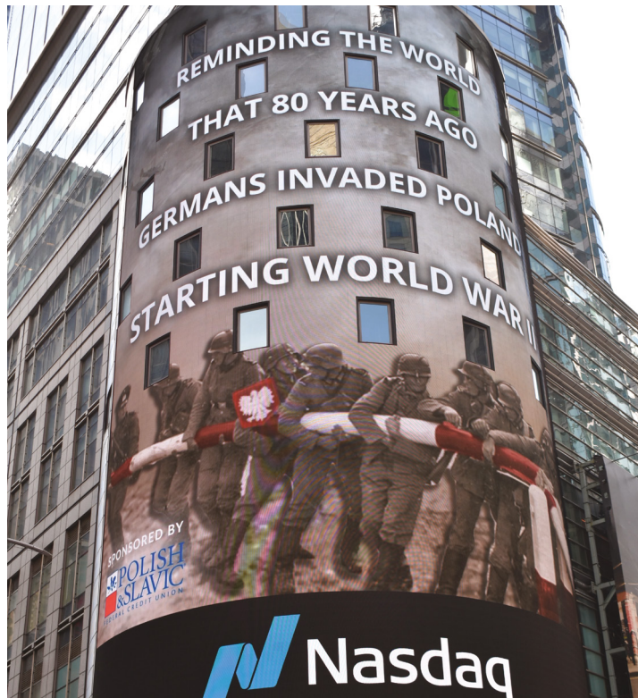
Baner wyświetlony na budynku NASDAQ w 80. rocznicę wybuchu II wojny światowej / Banner displayed on the NASDAQ building on the 80th anniversary of the outbreak of World War II

PSFCU also supported dozens of events commemorating both anniversaries organized by Polish Supplementary Schools, parishes and Polish-American organizations.