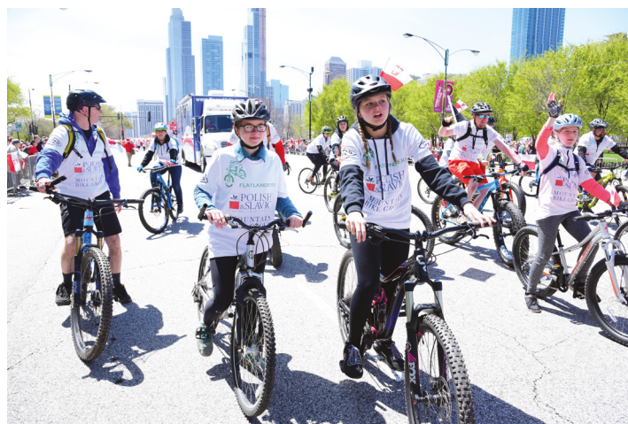
Nasza Unia tradycyjnie sponsorowała Paradę Konstytucji 3 maja w Chicago, IL PSFCU was the traditional sponsor of the May 3rd Constitution Parade in Chicago, IL

Our Credit Union representatives were also present at the Gen. Pulaski Day Parade, which marched through the streets of center city Philadelphia for the 83rd time.