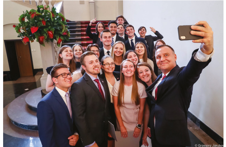
Laureaci programu stypendialnego pod auspicjami Prezydenta RP podczas spotkania w Pałacu Prezydenckim w Warszawie / Winners of the presidential scholarship program during their visit to the Presidential Palace in Warsaw

For the 19th consecutive year, the Polish & Slavic Federal Credit Union has helped make college education more affordable to hundreds of students by awarding $500,000 in scholarships as part of the 2019 PSFCU Scholarship Program.