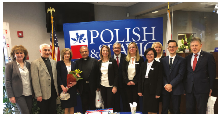
10. rocznica otwarcia oddziału PSFCU w Trenton 10th Anniversary of the PSFCU branch in Trenton