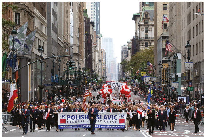
Kontyngent PSFCU podczas Parady Gen. Kazimierza Pułaskiego w Nowym Jorku PSFCU contingent at the Gen. Pulaski Day Parade in New York

Jak co roku, Nasza Unia była głównym sponsorem trzech parad polonijnych: Gen. Kazimierza Pułaskiego w Nowym Jorku i Filadelfii oraz Konstytucji 3 Maja w Chicago. PSFCU z dumą wspiera te przejawy przywiązania do polskich korzeni i tradycji w trzech największych skupiskach Amerykanów polskiego pochodzenia: Nowym Jorku, Chicago i Filadelfii.