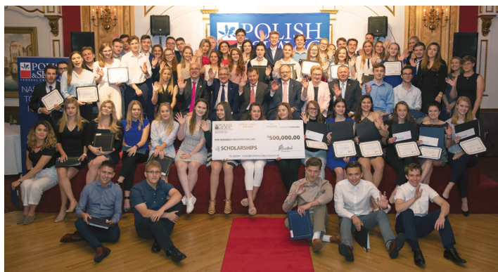
Ceremonia wręczenia stypendiów PSFCU w Wallington, NJ PSFCU Scholarship ceremony in Wallington, NJ